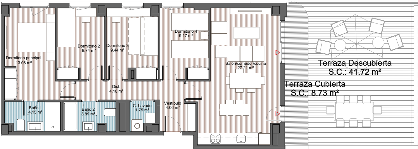
A3 - 1:120

PLANO SUJETO A CAMBIOS POR POSIBLES MODIFICACIONES DEL PROYECTO, SEGÚN SE REGULA EN CONTRATO. LA SUPERFICIE CONSTRUIDA INCLUYE LA PARTE PROPORCIONAL DE ZONAS COMUNES. EL MOBILIARIO DE INTERIOR / EXTERIOR Y EL AJARDINAMIENTO, ASÍ COMO LOS ELECTRODOMÉSTICOS NO REFLEJADOS EN LA MEMORIA DE CALIDADES, NO FORMAN PARTE DEL CONTRATO, Y SUS DIMENSIONES Y UBICACIÓN EN ESTE PLANO SON ORIENTATIVAS. LOS APARATOS SANITARIOS Y ELECTRODOMÉSTICOS INCLUIDOS EN LA MEMORIA DE CALIDADES, SI FORMAN PARTE DEL CONTRATO, Y SUS DIMENSIONES Y UBICACIÓN EN ESTE PLANO SON ORIENTATIVAS.